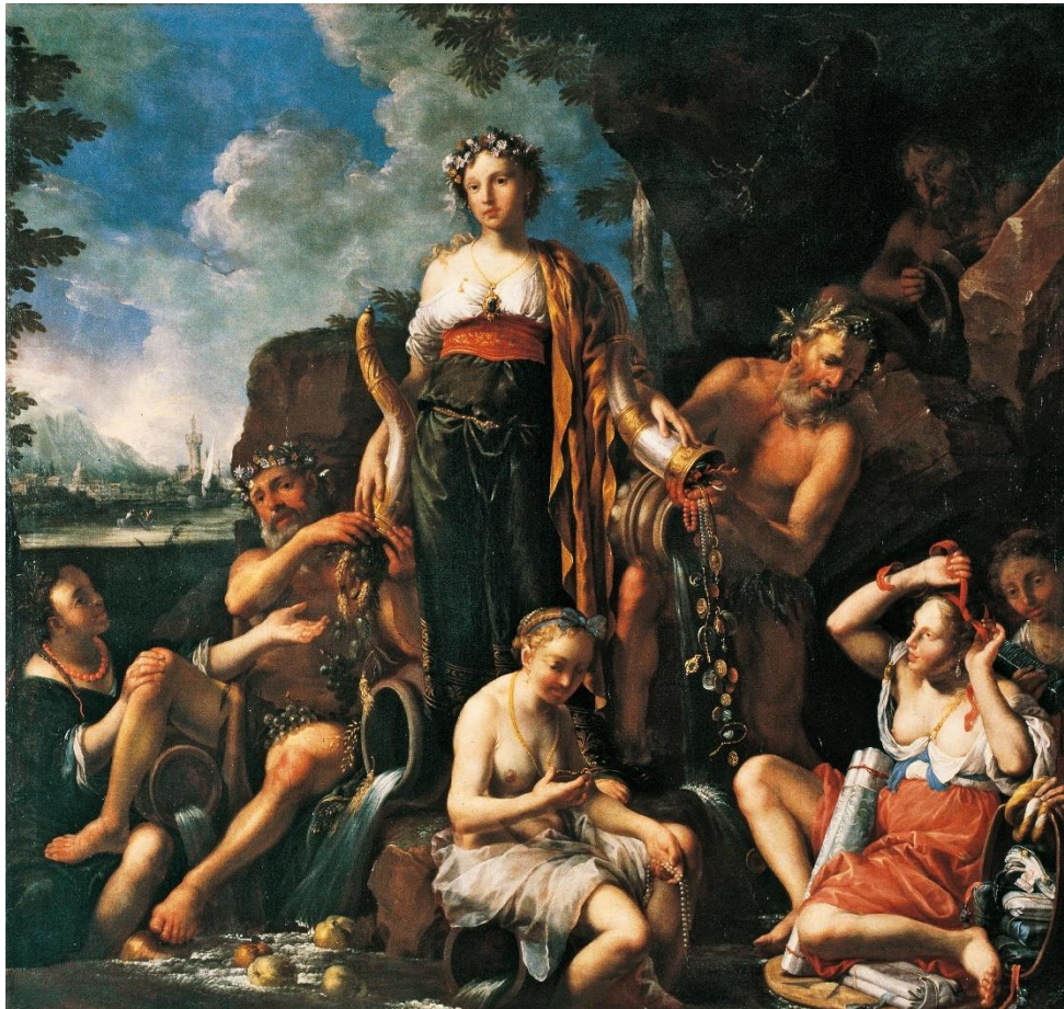
Johann Heiss, Allegoria dell'Abbondanza con divinità fluviali , 1698 ca.

in una parte teorica con una visita guidata al Museo Mercantile per ammirare le opere originali e confrontarle con quelle realizzate dagli alunni.