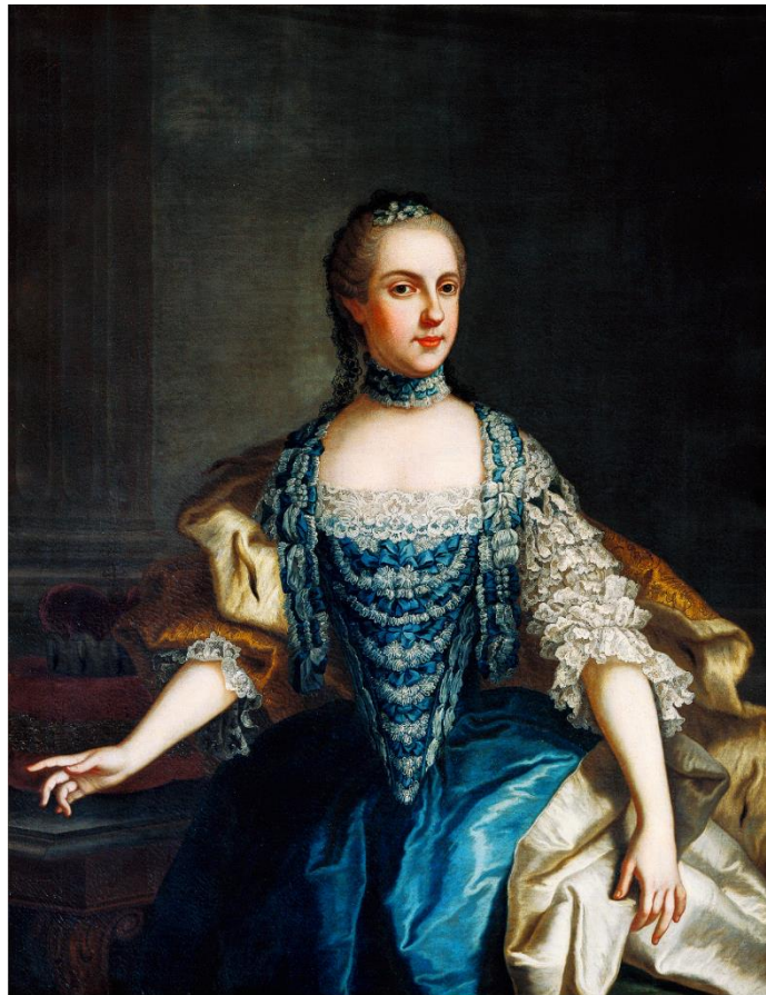
Scuola veneziana, Maria Isabella di Borbone-Parma , 1760 ca.

in una parte pratica di approfondimento con un breve questionario su abiti e acconciature (materiale didattico da richiedere).