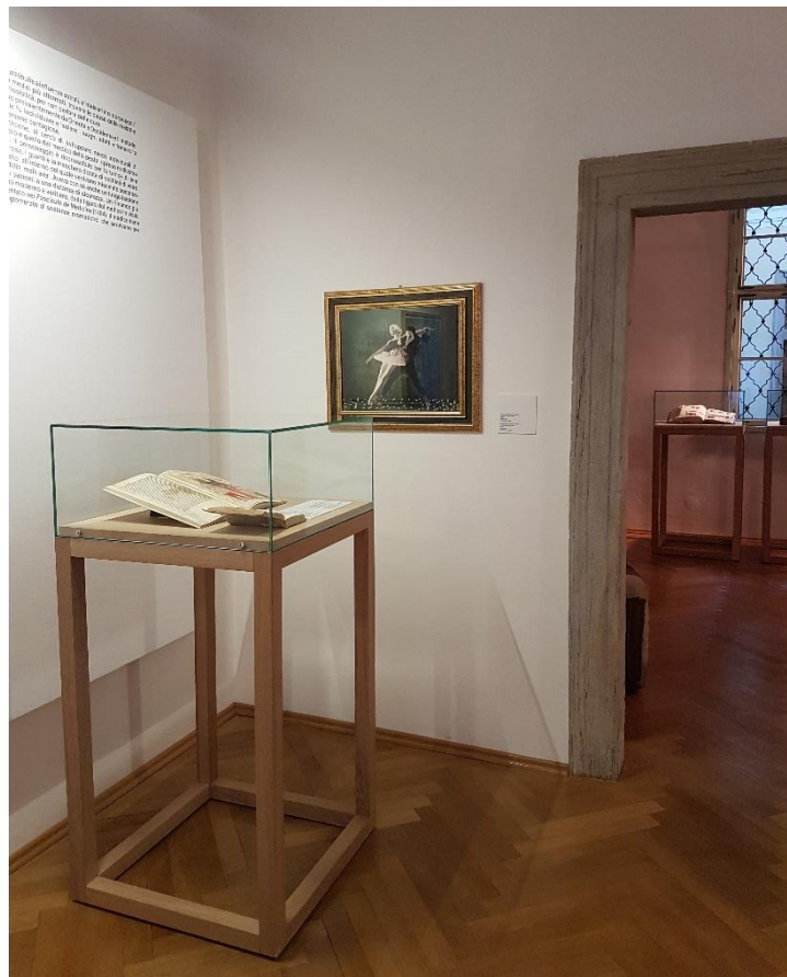
Una delle sale della mostra

In mostra sono esposti libri antichi, itinerari di viaggio, manuali di commercio, documenti ad uso dei mercanti. Interessanti sono gli oggetti che riguardano la sfera medica e la religione, in particolare alcune testimonianze delle epidemie nell'arte locale. Una sezione della mostra è dedicata alla teriaca, farmaco 'miracoloso' prodotto a Venezia, e non manca infine un rimando moderno al 'medico della peste'.