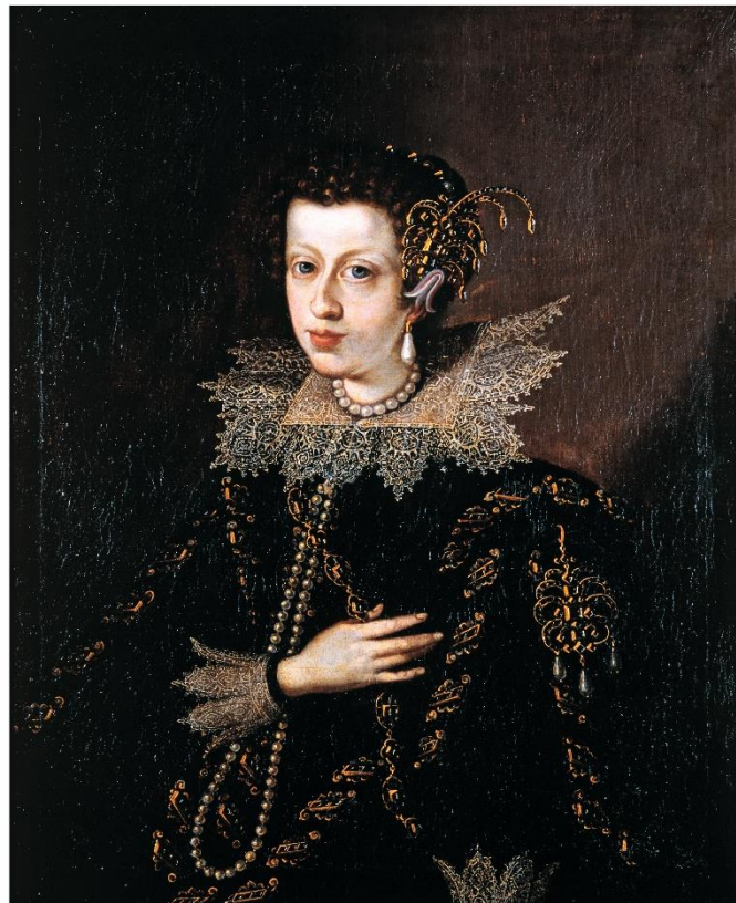
Anonimo, Claudia de' Medici , 1645/1648

Studentesse e studenti delle scuole secondarie