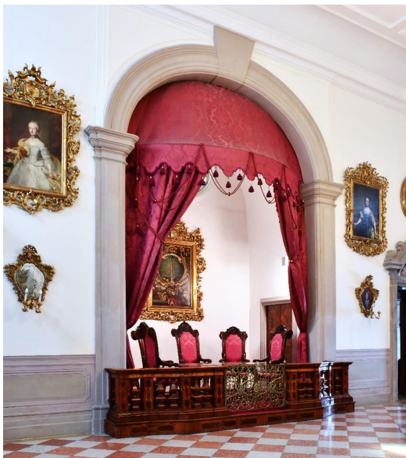
La nicchia dei giudici del Magistrato Mercantile nel Salone d'onore

Studentesse e studenti delle scuole secondarie