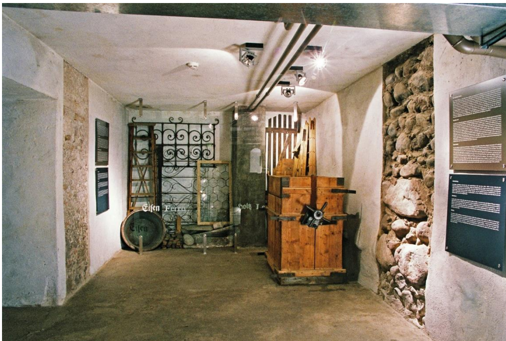
Uno dei locali della cantina di Palazzo Mercantile

Studentesse e studenti delle scuole secondarie